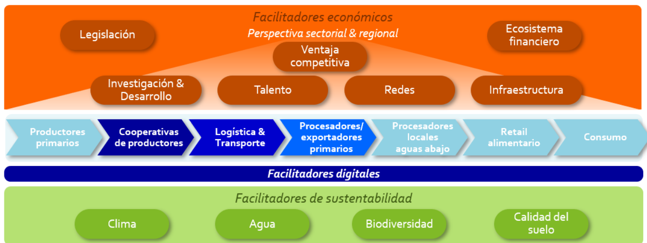
Figura 5: El Marco del Sistema Alimentario.

Las cooperativas siguen siendo importantes si logran ajustarse a las tendencias de los consumidores hoy y mañana, si logran entender la dinámica en un sistema alimentario y definir su valor en este sistema alimentario. A partir de la evolución de las cooperativas, Rabo Partnerships ha diseñado el siguiente marco para ayudar a las cooperativas agrícolas en el desarrollo de un modelo de negocios económicamente sustentable, llamado ‘Una Cooperativa en un Sistema Alimentario’.