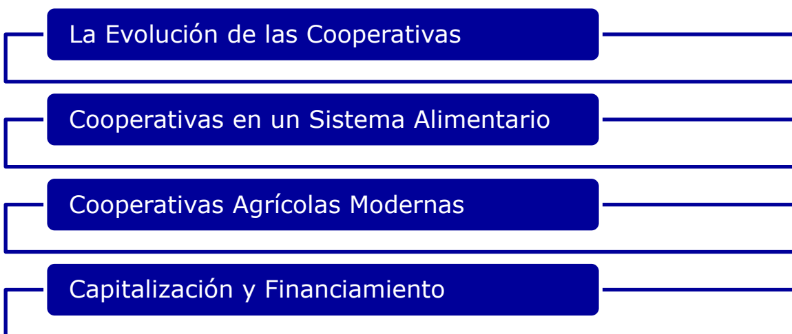
Figura 1: Resumen de los módulos en el currículum para las cooperativas modernas.

El presente currículum abordará ambos aspectos, una cooperativa como empresa y una cooperativa como asociación, y está compuesto por los siguientes cuatro módulos.