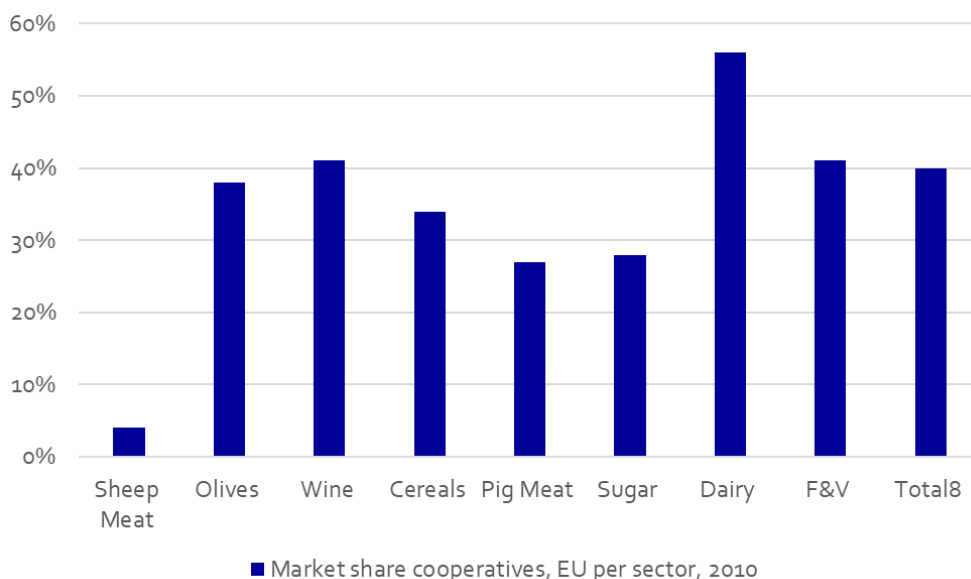
Figura 2: Participación del mercado UE por sector. Fuente: Bijman et al. (2012)

Entre los países europeos existe una gran diferenciación en cuanto a la importancia de las cooperativas para el sector agrícola (Figura 3). Mientras en Finlandia el 75% de todos los productos agrícolas es comercializado a través de cooperativas, los países de Europa del Este muestran cifras mucho más bajas. Si bien estas cifras son del 2010, nuestra expectativa es que la importancia relativa no ha cambiado sustancialmente en la última década.