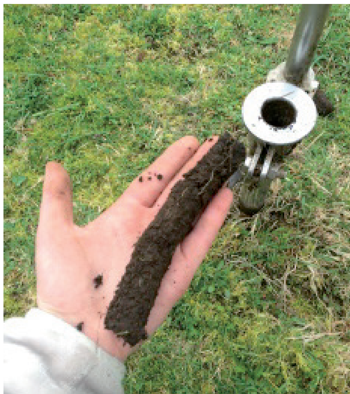
Figura 4. Una submuestra extraída con barreno a 20 cm de profundidad.