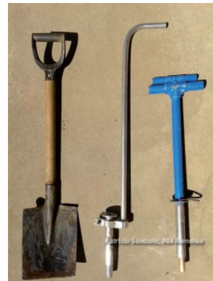
Figura 1. Instrumentos para toma de muestras. Pala recta y barrenos diferentes.

a) Si utiliza una pala tome cada submuestra, cuidando que todas sean de la misma profundidad y ancho de la lámina de suelo.