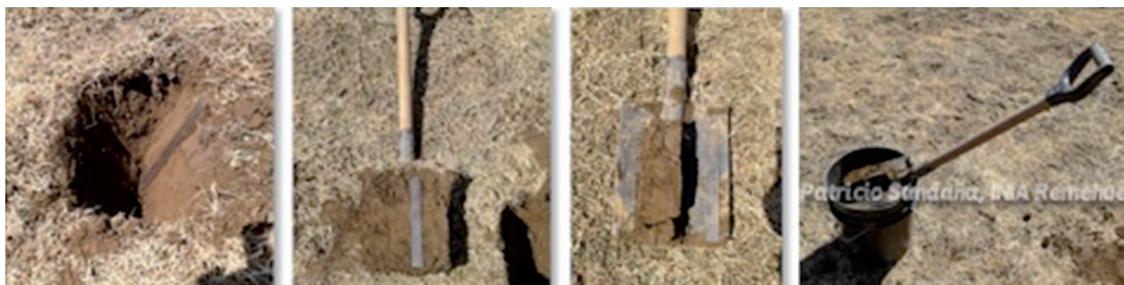
Figura 3. Submuestra tomada con pala.

Cada submuestra extraída se va agregando a un balde plástico, saco o bolsa grande bien identificada y limpia. Acompañar la muestra con los antecedentes e identificación en el formulario proporcionado por el laboratorio. Si no es posible enviar la muestra de inmediato, mantenerla en un lugar fresco y/o refrigerado