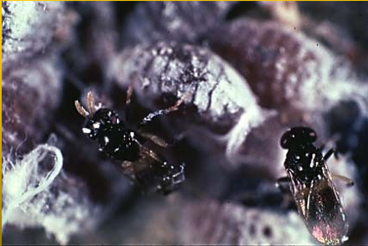
Aphelinus mali parasitoide del pulgón lanígero del manzano